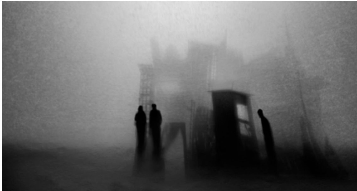
© Pilar García Merino. Serie "Desequilibrios"

Un total de catorce exposiciones vertebrarán el recorrido del Festival, siendo la idea dar cabida a toda la fotografía que se hace y se ha hecho en España y Latinoamérica.