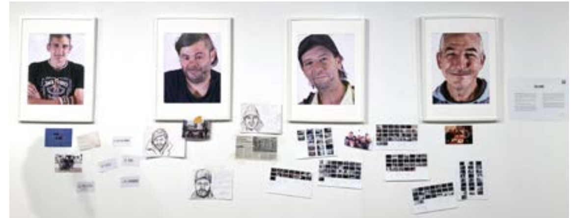
© Paco Sanz - Exposición Callejeros (Método fotovoz)

Durante la duración del Festival, tendrán lugar multitud de actividades que, o bien complementan las exposiciones, como son los casos de la charla sobre Fotografía de calle de Luis Baylón, o la mesa redonda en torno al apropiacionismo, que tiene su punto de partida en la exposición de Eugenio Vizuete, o bien son ofertas para que los asistentes al festival conozcan métodos para mejorar sus fotografías o aprender técnicas nuevas. En este caso, se puede aprender las técnicas innovadoras del Smartphone (todos lo utilizamos pero no sabemos sacarle el mayor partido a esta herramienta) o las técnicas históricas de la fotografía estenopéica (con los talleres de las Fitolateras, tanto para niños como para adultos) donde se enseñara a los asistentes al taller como hacer fotos con una lata.