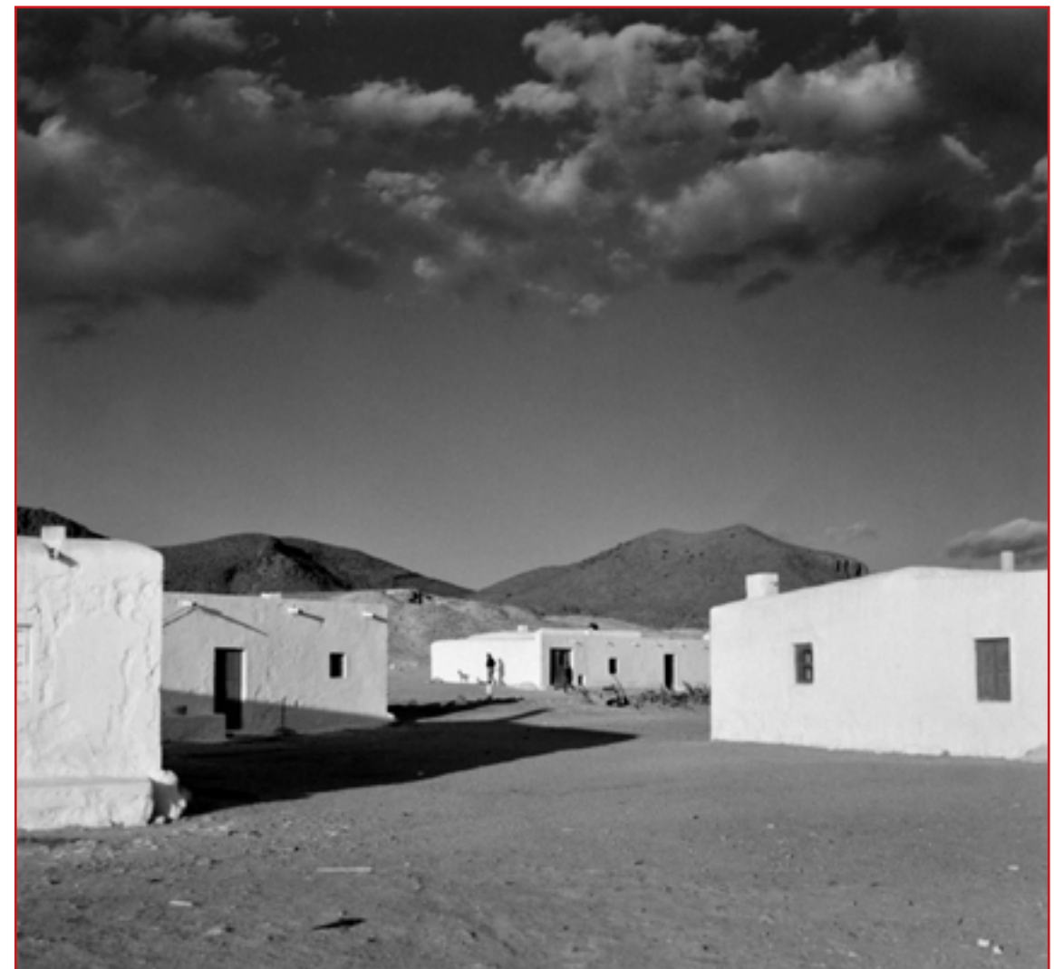
© Carlos Pérez Siquier. Isleta del Moro, Almería, 1970.

CA LAMBERT Carrer Major, 40 (Xàbia) Inauguración: 14 de septiembre, 20.30 h Periodo expositivo: del 14 de septiembre al 20 de octubre Horario de sala: martes-viernes 10:00–13:00, 18:00–21:00 sábado 10:00–13:00 Domingo y lunes Cerrado